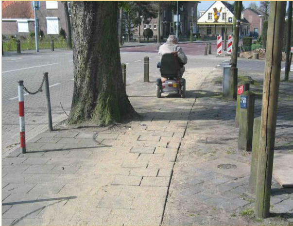
Bergstraat: t.h.v. oversteekplaats naar Groenstraat

De doorgang tussen de boom en de paaltjes is slecht berijdbaar.