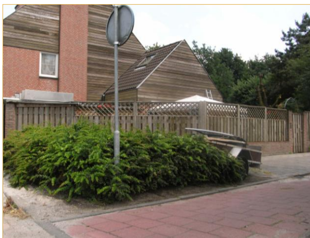
Parkeerplaats bij De Winnepoort

... en het trottoir is onbereikbaar door het plantsoen, de parkeerplaatsen links en het ontbreken van een trottoirverlaging