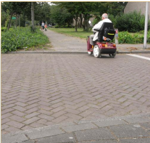
Gertrudisdal hoek Norbertusdreef

Trottoirverlaging ontbreekt aan beide zijden van de straat. Zie ook 2a