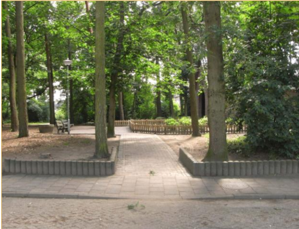
Helenadal: kapel Brouwersbos

Trottoirverlaging is niet aangelegd volgens de norm.