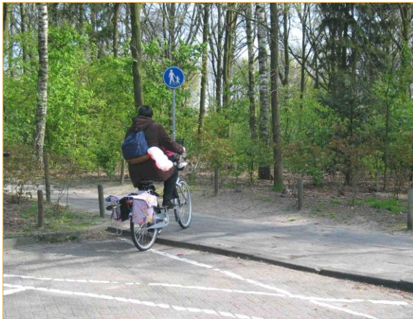
Brouwerijdreef: toegang naar Souvereinhof