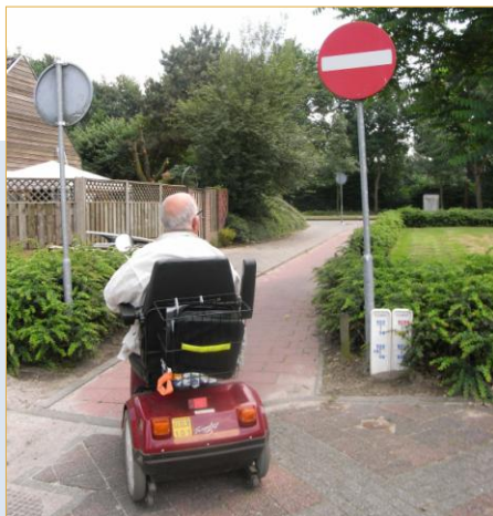
Parkeerplaats bij De Winnepoort