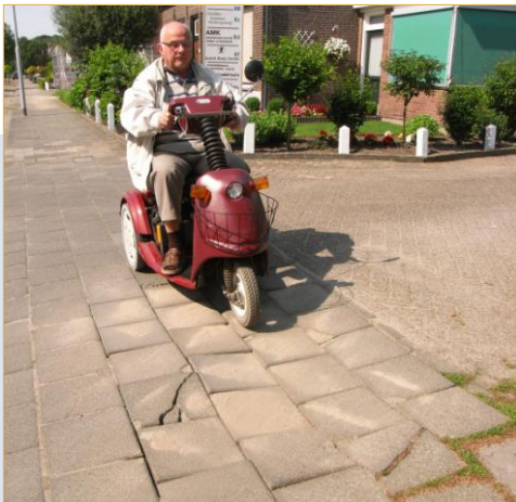
Kerkakkerstraat: inrit industrieterreintje bij huisnummer 8