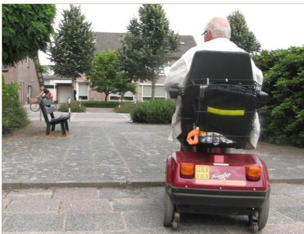
Norbertusdreef: t.h.v huisnummer 47

Trottoirverlaging bij de oversteekplaats ontbreekt aan de zijde van de ventweg.