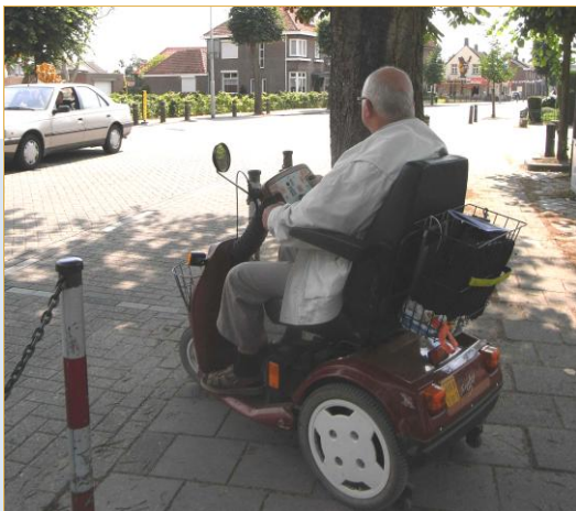
Bergstraat: oversteekplaats naar de Groenstraat

De boom belemmert het uitzicht op naderend verkeer van rechts.