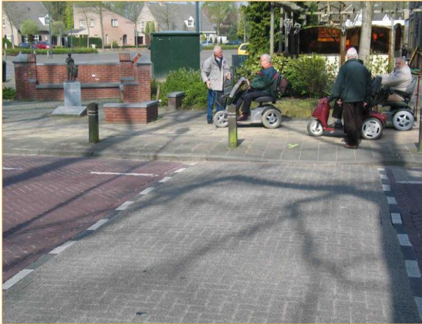
Bergstraat: oversteekplaats bij de Martinuskerk