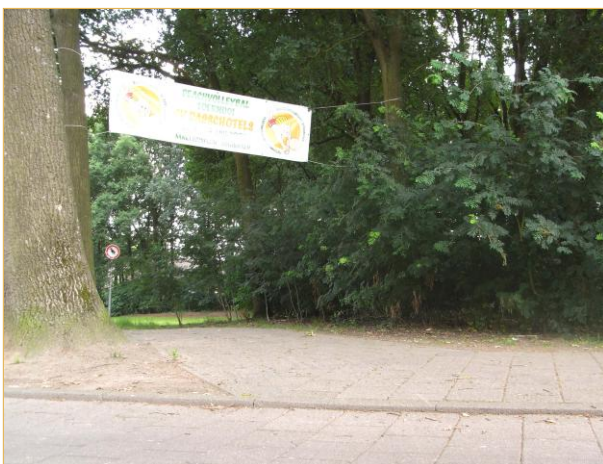
Tienendreef: oversteekplaats bij Damianusdreef

en ... aan de oostzijde ontbreekt de trottoirverlaging.