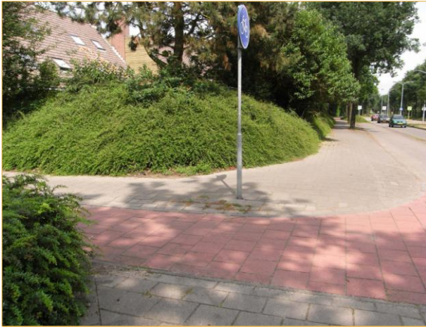
Parkeerplaats bij De Winnepoort

Geschikte toegang tot de parkeerplaats en de winkels vanaf de Tienendreef