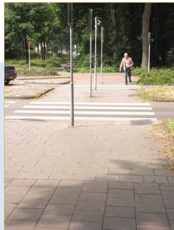
Tienendreef: oversteekplaats bij Damianusdreef