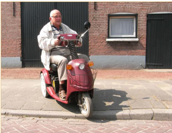
Bergstraat: t.h.v. Fysiotherapiepraktijk Dommelen

Trottoirverlagingen aan beide zijden van de Bergstraat ontbreken.