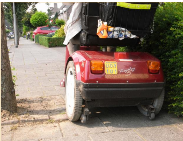
Kerkakkerstraat: t.h.v. huisnummer 34

De doorgang tussen de heg en de boom is te smal en slecht bereikbaar.