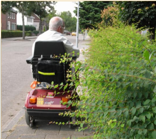
Kerkakkerstraat: t.h.v. huisnummers 2 en 4

Moeilijke doorgang als gevolg van niet gesnoeide heg.