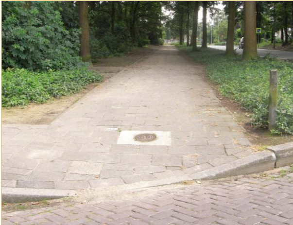
Norbertusdreef: hoek Evelinadal

Trottoirverlaging is niet aangelegd volgens de norm. Dit geldt voor de gehele route aan deze zijde van de Norbertusdreef (6 locaties).